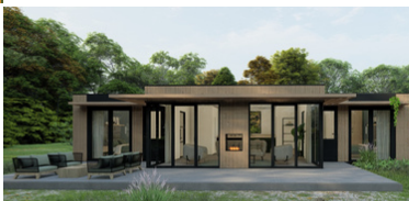
'T HEERDES BOS